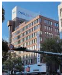
カスタマーセンター（宮崎）